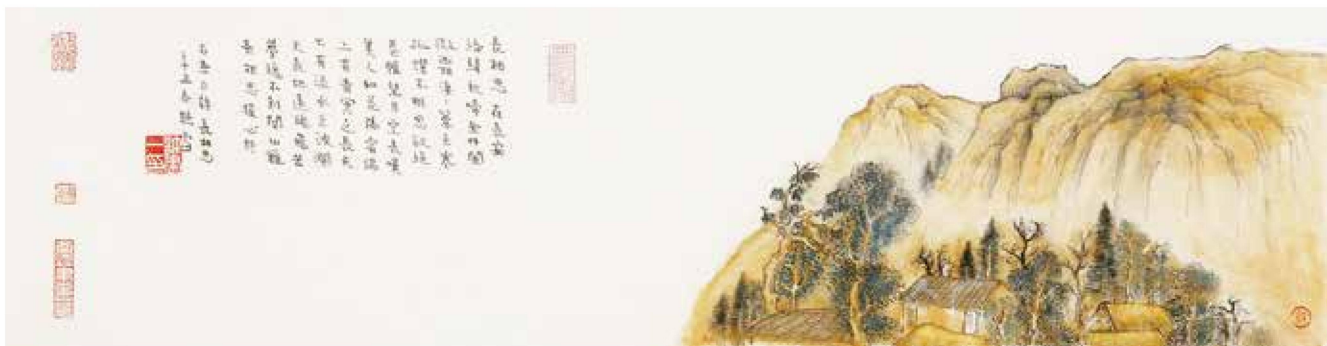
3. 许建一 残阳故乡情 17cm × 65cm 2021

建一兄书画兼擅，风格古雅，颇有可观。书法四体皆备，尤对商周金文用功颇深，吾喜其章草之活泼清新，又喜其真书深得《张迁碑》《爨宝子》笔意，古朴典雅，品格自高。其山水意境清远，悠悠简素，极富古韵。建一兄又擅金石，书画创作融汇碑学帖学、古典现代，令人钦敬矣！